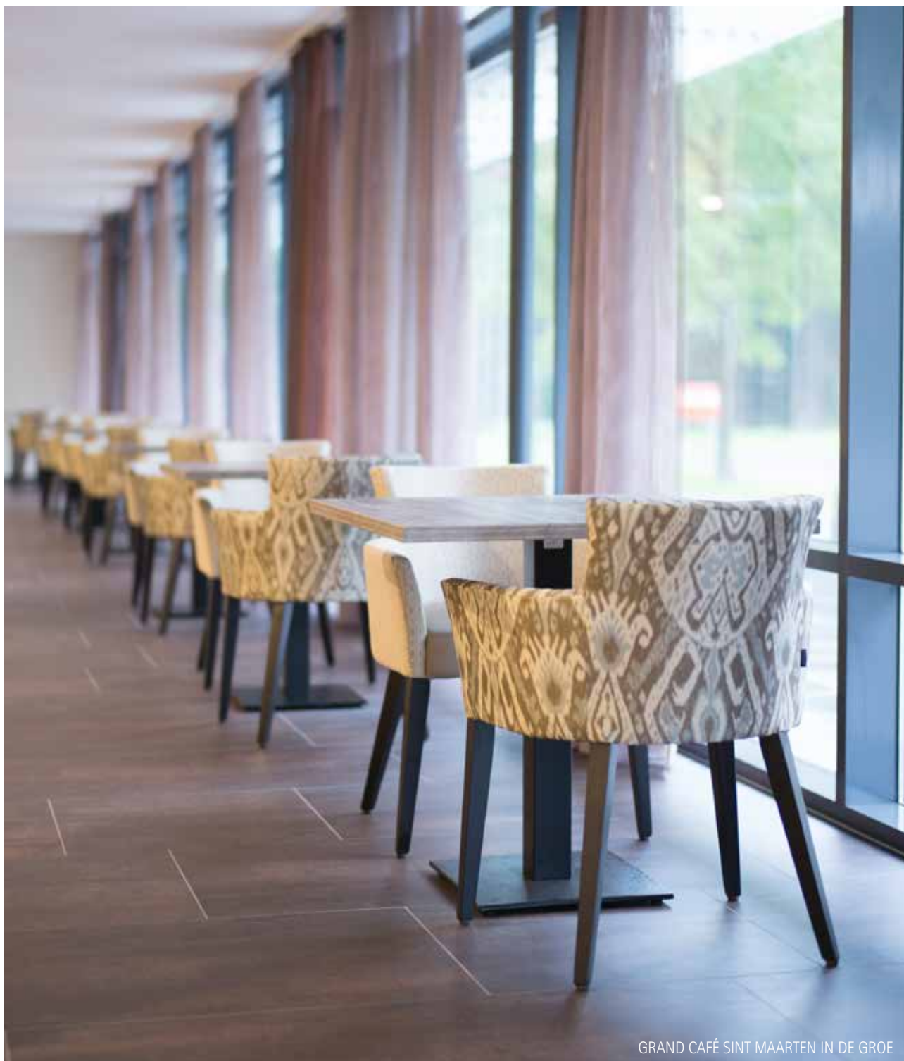
GRAND CAFÉ SINT MAARTEN IN DE GROE