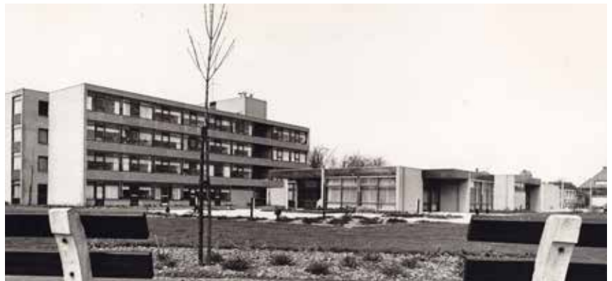
IN DE ZOMER VAN 1971 WERD DE BOUW VAN SINT MAARTEN IN DE GROE VOLTOOID. NU, RUIM 43 JAAR LATER, IS ER EEN SPLINTERIEUW WOONZORGCENTRUM VERREZEN AAN DE BEUKENSTRAAT EN WORDT HET OUDE GEBOUW GESLOOPT

De sloop van het laag- en hoogbouwgedeelte zal ongetwijfeld wel duidelijk te zien (en soms ook te voelen) zijn. Met behulp van een sloopkraan zal het hele gebouw in stukken worden 'geknipt'. Het materiaal dat daarbij vrijkomt, wordt afgevoerd met vrachtwagens. Deze vrachtwagens zullen zoveel mogelijk via de Beukenstraat en het Laantje van Westdorp het bouwterrein oprijden en in omgekeerde richting weer wegrijden. Tijdens de sloop zal voorzichtig worden gewerkt om te voorkomen dat er overlast ontstaat. Ook worden de bouwhekken voorzien van doek en zal er zonodig worden gespreoid om stofvorming te voorkomen."